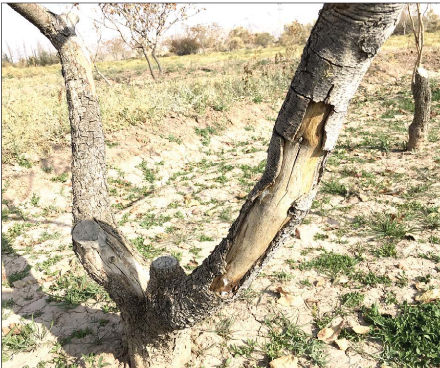
از بین رفتن پوست تنه درخت پسته و نیاز به انجام هرس کف بری.

یکی از مهمترین اهداف هرس، بازجوان سازی درختان مسن و یا امکان تغییر پیوند (سرشاخه کاری) می باشد. سوالات زیادی از طرف باغداران در مورد این هرس وجود دارد. این همان نوع هرسی است که انجام آن نیازمند تغییر اساسی در نگرش باغداران است. بسیاری از درختان پسته در باغ های استان کرمان به دلیل عدم مدیریت صحیح، وضعیت رشدی نامناسب و بیمارگونه ای دارند. از طرفی تاج درختان هم به فرم مشخصی تربیت نشده است. هرس بازجوان سازی یک فرصت جدید برای اصلاح فرم درخت و تشکیل شاخه های جدید و با رشد مناسب فراهم می کند. بایستی دقت شود هرس بازجوان سازی روی شاخه های اسکلتی درخت و الزاماً از محلی که پوست سالم وجود دارد، انجام شود