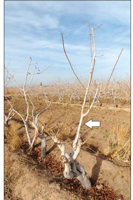
هرس باز جوان سازی درخت پسته روی شاخه های اسکلتی (سمت راست)، پیکان نشان دهنده شاخه آبکش (پرستار) و هرس باز جوان سازی شدید روی تنه اصلی (سمت چپ).