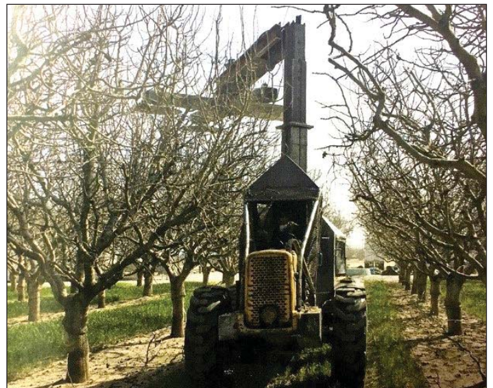
هرس مکانیکی سرزنی (Topping) (سمت راست) و حاشیه زنی (Hedging) (سمت چپ) در باغات پسته کالیفرنیا